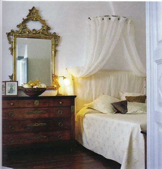
επάνω: Το παλιό, σιδερένιο κρεβάτι, ο βενετσιάνικος καθρέφτης και η σιφονιέρα «ήρθαν» από διαφορετικές «πηγές» και προσαρμόστηκαν με επιτυχία στο ρομαντικό υπνοδωμάτιο.